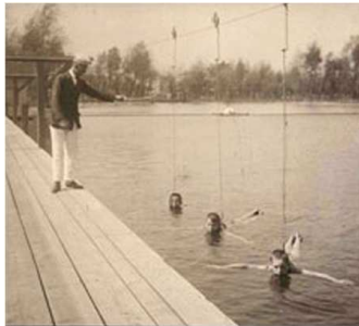
Gänsehäufel - schon seit vielen Jahren erfrischend im Sommer...

Der Sommer ist da... und mit ihm Yoga im Bad und die "10 Tage 10 Euro" Aktion. Endlich sind die Temperaturen so richtig nach unserem Geschmack!! Die letzten Schultage gehen vorüber und dann macht sich die ganze Stadt fertig für die Sommerferien. Es wird ruhiger in den Strassen und es gibt wieder mehr Parkplätze. Wir haben den ganzen Sommer über Klassen für euch. Zu jeder Morgens-, Vormittags-, Nachmittags- und Abendzeit gibt's bei uns Bikram Yoga, und es ist bestimmt für jeden von euch was dabei. Und wenn ihr nicht im Hotroom, sondern lieber im Bad schwitzen wollt, dann kommt uns im Gänsehäufel besuchen.