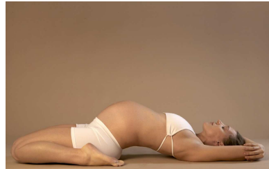
Yoga und Gesundheit

Entzündungswert Interleukin-6 (IL-6) bei erstgenannten niedriger war und selbst durch Stress weniger schnell bzw. nicht anstieg. Zusammenfassend ist zu sagen, dass die erfahrenen Yoginis sowohl körperlich als auch emotional besser mit Stress umgehen konnten und von Anfang an niedrigere Entzündungswerte hatten. Es ist bekannt, dass Entzündungen eine bedeutsame Rolle bei der Entstehung vieler Krankheiten spielen. Yoga ist ein einfacher und angenehmer Weg, die Risiken für Herzkrankheiten, Diabetes oder andere altersbedingte Erkrankungen zu reduzieren.